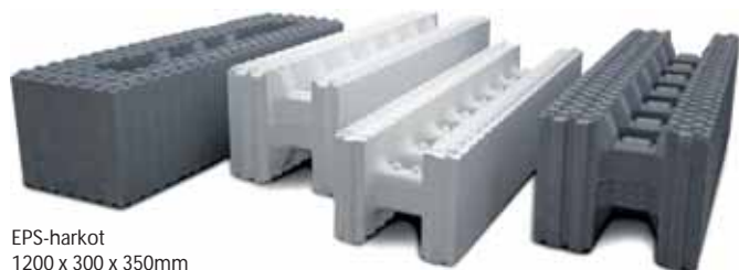
EPS-harkot 1200 x 300 x 350mm 1200 x 250 x 300mm 1200 x 250 x 200mm Betonimenekki 120 l/m 2