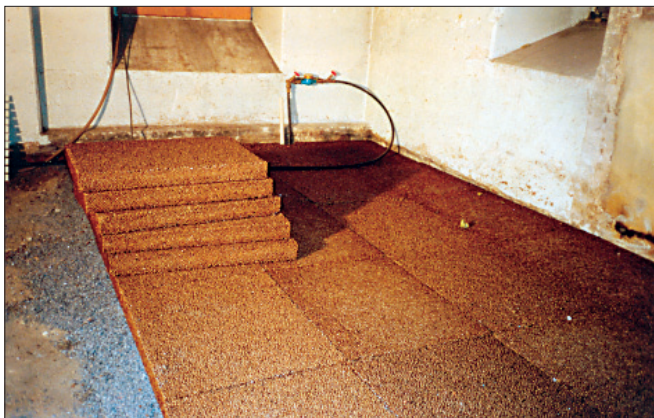
Lämmöneristys, salaojitus ja kapillaarikatko

- ei vedenpainetta maan ja seinän välissä - kapillaari-ilmion kääntö ulospäin