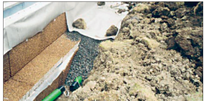
Fuktisol on korjausrakentamisen erinomainen vaihtoehto

salaojitus, lämpöeristys, kosteuseristys, kapillaari-ilmion katkaisu